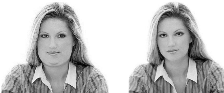
Slika 1. Fotografije pretila osobe i osobe prosječne težine korištene u hipotetskom životopisu.

opisa posla pravnik u elektroničkom izdanju Vodiča kroz zanimanja (Šverko, 1998). Opis kompetencija i radnih zadataka u životopisu osmišljen je tako da bude vrlo općenit te da se iz njega ne može puno zaključiti o stvarnim karakteristikama kandidata, već da se procjene moraju donositi na temelju dojma. Iako su i muškarci i žene žrtve predrasuda, korištena je fotografija ženske osobe jer istraživanja potvrđuju da pretilost ima negativnije posljedice za žene, i u socijalnim i u poslovnim situacijama (npr. Fikkan i Rothblum, 2012; Maranto i Stenoien, 2000). Fotografija osobe preuzeta je s internetske stranice Free Great Picture (Free Great Picture, n.d.), koja nudi slobodno preuzimanje i korištenje primjeraka različitih fotografija.